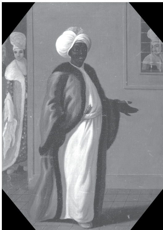
Кизляр-ага султанського гарему. Ф. Сміт. XVIII ст. 54,6 x 38,7 см. Ельський центр британського мистецтва (США)

Для перетворення обирали хлопців, у яких ще не почалося статеве дозрівання. Ідеальним віком вважали 8 років. Жертву прив'язували до столу, орган перетягували мотузкою і різали гострим лезом. Рану припікали розжареним залізом або заливали смолою, у канал для виведення сечі вставляли бамбукову трубочку. Потім дитину на кілька днів закопували по шию в гарячий пісок.