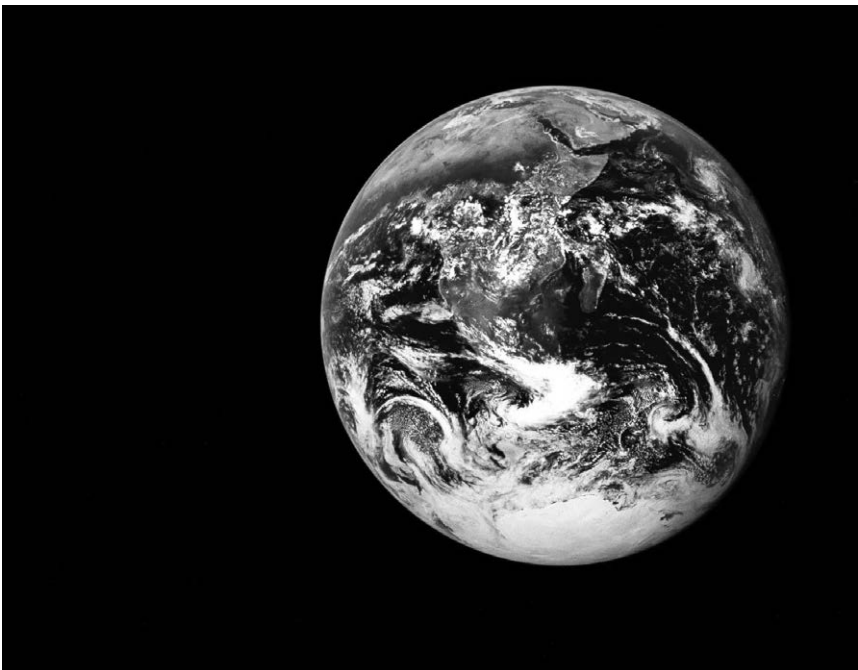
Фото Землі від місії «Аполлон-17».

Моряки ретельно фіксували обриси материків. Географи перетворювали їхні замальовки на мапи й глобуси. Фотографії невеликих ділянок Землі отримували спочатку з повітряних куль чи літаків, потім із ракет у короткому балістичному польоті, нарешті, за допомогою космічного апарата на орбіті — із такої перспективи, як на відстані кількох сантиметрів від великого глобуса. У той час коли майже всіх учать у школі, що Земля являє собою кулю, до якої ми приклеєні гравітацією, реальність цієї ситуації ще не доходила до нас по-справжньому, доки не з'явилося славнозвісне фото всієї Землі з «Аполлона-17», зроблене тоді, коли його команда вирушала в останній на сьогодні людський політ на Місяць.