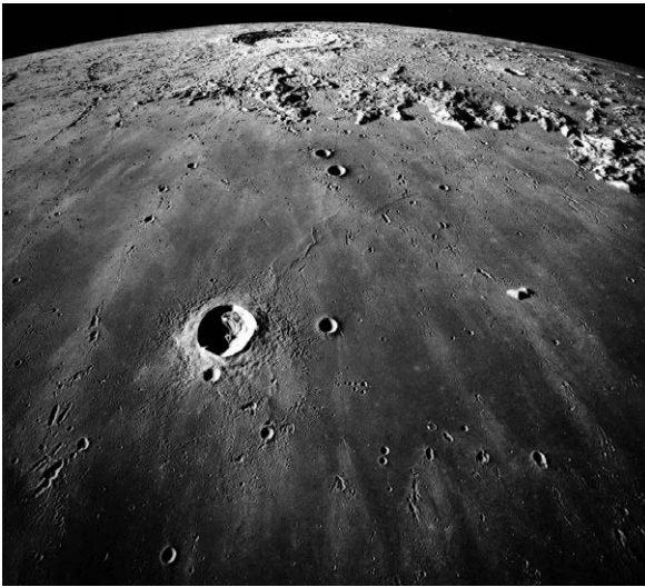
Сучасні спостереження підтверджують висновок Галілея, що поверхня Місяця не є гладенькою й відполірованою. Вид на Море Дощів (у центрі) і кратер Коперника (угорі коло горизонту) Знімок «Аполлона-17», надано NASA.

Натомість Галілей учив, що ми можемо ставити питання Природі за допомогою спостережень і дослідів.