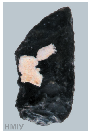
Мисливська зброя. Гостроконечник крем'яний. 70 тис. років тому. Середній палеоліт. Кабазі V. С. Малинівка, Крим

ти знову й знову. Цілком реальні прототипи легендарного молота було вперше розроблено (і широко застосовано) на теренах Європи наприкінці VI тис. до н. е, тобто приблизно сім тисяч років тому, після чого впродовж майже трьох наступних тисячоліть вони залишалися на озброєнні воїнів багатьох племен. Це була історична подія, адже від тих часів можемо вести відлік доби спеціалізованої зброї, призначеної виключно для війни. Її застосування вимагало нових навичок, постійних тренувань, нарешті, певних зрушень у свідомості — як того, хто її застосовував, так і суспільства в цілому, яке долучилося до процесу, називаного словом «війна». Бойова сокира-молот швидко стала символом влади, її постійно вдосконалювали — на зміну каменю прийшов метал (спочатку мідь, потім — бронза, далі — залізо), невідомі нам «конструктори» розробляли нові обриси — більш смертоносні і водночас такі, що вабили досконалістю форм. Так народжувалася та магія зброї, яка не залишає байдужим та бентежить і сьогодні кожного, хто споглядає зброю або торкається до неї.