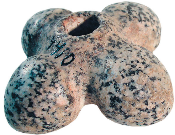
Булава, камінь. Трипільська культура, друга половина V тис. до н. е. Подніпров'я. Національний музей історії України

Бойовий молот та кинджал, мідь. Новоданилівська культура, друга половина V тис. до н. е. Село Петро-Свистуново, Запорозька область. Археологічний музей Інституту археології НАН України, Київ