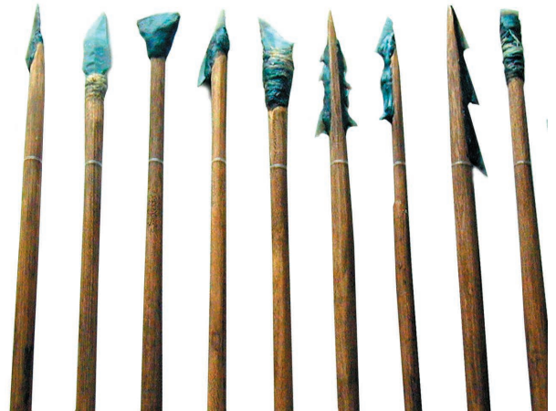
Стріли з крем'яними вістрями. Мезоліт (IX—VIII тис. до н. е.). Реконструкція Д. Нужного, Археологічний музей Інституту археології НАН України, Київ

вояків. У культурній спільноті Кукутень-Трипілля наприкінці V — у IV тис. до н. е. з'являються союзи племен — вождівства, здатні виставити по кілька тисяч воїнів (в окремих випадках до 3—7 тисяч). Ураховуючи концентрацію населення в протомістах (налічували до 15 тисяч мешканців), контингент у кілька тисяч вояків було зосереджено в окремому місці. До найбільш потужних складних вождівств долучалися сусіди-союзники, загальна кількість ополчення в такому випадку могла теоретично сягати 10 тисяч і більше осіб.