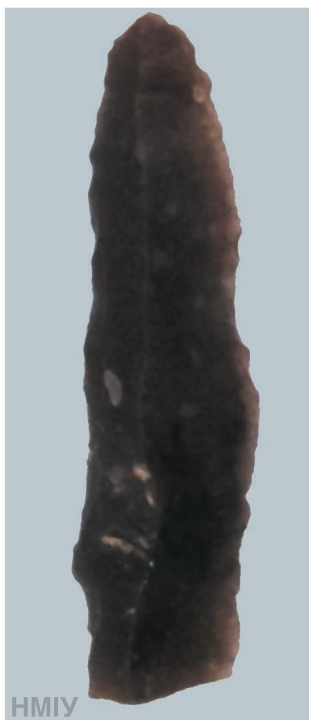
Мисливська зброя. Бойова частина вістря стріли. 13 600 років тому. Пізній палеоліт. Село Семенівка, Київська область

У скандинавській міфології, корені якої сягають дуже давніх часів, є образ могутнього бога Тора. Переможець крижаних велетнів мав на озброєнні чарівний бойовий молот, здатний знищити будь-якого ворога. Диво-зброя завжди поверталася до господаря, її можна було мета-