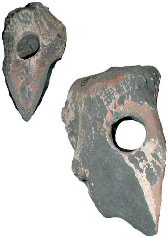
Молоти, рiг оленя. Дерейвська культура, кiнець V — перша половина IV тис. до н. е. Село Дерейвка, Кiровоградська область. Археологiчний музей Інституту археологiї НАН України, Київ

Військові конфлікти зафіксовано виключно на підставі археологічних джерел. Нижче згадано деякі з таких подій.