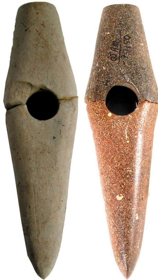
Сокири-молоти, камінь. Трипільська культура, кінець VI — початок V тис. до н. е.

1 — поселення Окопи, Тернопільська область; 2 — поселення Олександрівка, Одеська область