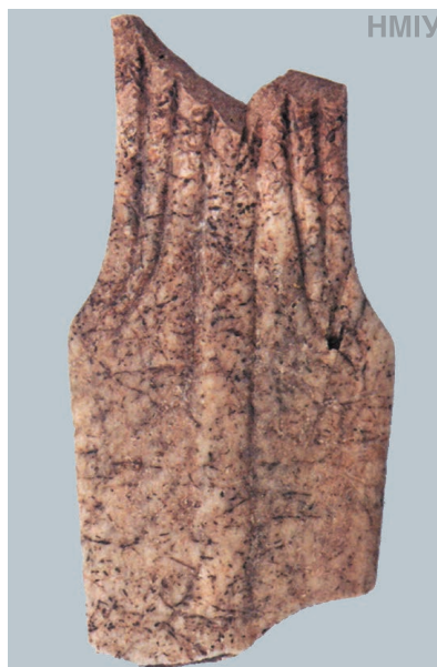
Кинжал кістяний (фрагмент). Кінець IV тис. до н. е. Трипільська культура. С. Грим'ячка, Хмельницька область

Разом із тим виявляється, що описана ще давньоримськими авторами тактика ведення бою германців та слов'ян, а також притаманний їм комплекс озброєнь сягають часів існування (до речі, на тій самій території) культури кулястих амфор, а це III тис. до н. е. Притаманний згаданим культурам комплекс озброєнь: лук зі стрілами, дротики, сокира для ближнього бою — збігається до дрібниць (із тією лише різницею, що кремій, камінь та кістку у виготовленні озброєння через чотири тисячі років було замінено на залізо).