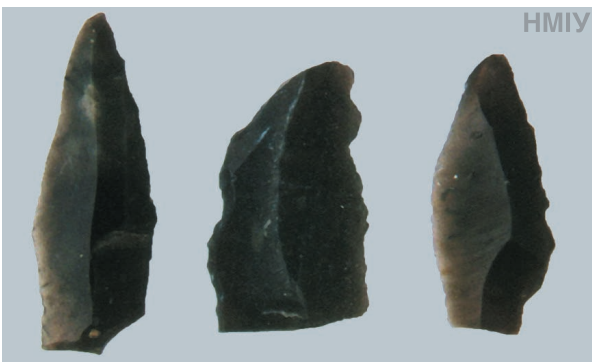
Вістря до стріл ланцетоподібні крем'яні. 15 тис. років тому. Пізній палеоліт. С. Мезін, Чернігівська область

На початку розглядуваного періоду з військовою метою використовували комплекс мисливського озброєння (КМО), до якого належали лук зі стрілами, дротики та спис. Як засіб «подвійного використання» побутували пласкі сокири. Їх застосування у війську зафіксоване для Європи даними біоархеології (травми на кістках загиб-