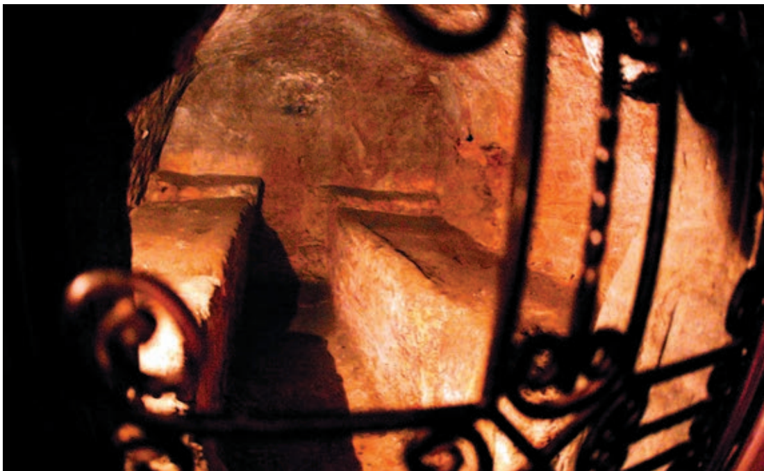
✠ Келії затворників / Кельи затворников / Anchorites' cells

Two seclusions are known to have gone wrong. Those were the seclusions of the Venerable Nikita and the Venerable Isaacius, who decided to go into seclusion on their own, without a blessing from senior priests. So Devil got to them through their pride. Demons talked Nikita into reading nothing but the Old Testament, without the Gospel, and persuaded him that he had pleased God so much that he needed to pray no more. Especially considering that Nikita knew the Old Testament by heart! When the brethren saw that he was in trouble ('in temptation'), they began to pray for him. When demons finally left the recluse alone, he could not remember a single line from the Bible! As for Isaacius, demons appeared to him as angels, showed him a false Christ and ordered him to bow before the