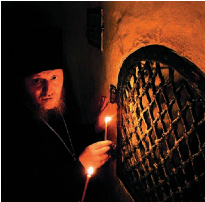
✠ Вулиця Затворників / Улица Затворников / Street of Anchorites

великий духовний досвід і благословення священновладдя, оскільки в затворі напад диявольський набагато сильніший, ніж коли чернець живе серед братії. Якщо в миру диявол найчастіше нападає на людину через фізичні прояви (ситуації, хвороби), то в затворі — через помисли.