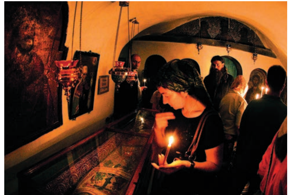
✠ Біля святих мощей / У святих мощей / At the holy relics