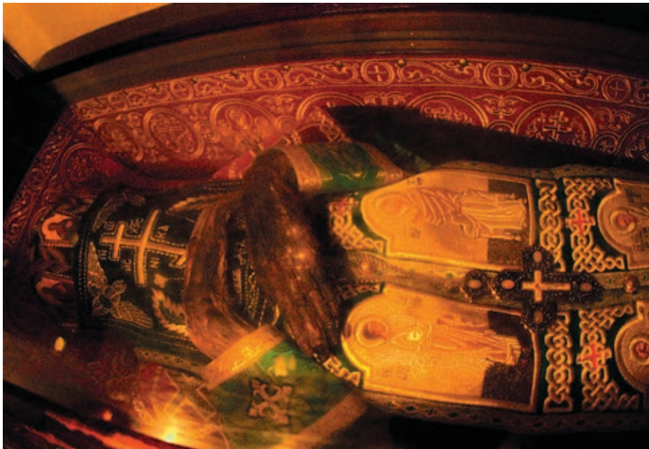
✠ Нетлінність упродовж 700 років / Нетленность в течение 700 лет / Incorruptible for 700 years

“There are three signs of a person’s holiness: saintly life, incorruptible relics and afterlife miracles,” says Archimandrite Polycarp. “The first monks of the Lavra were buried in caves according to Athos’ tradition. On Mount Athos, they do not keep the dead for more than a day because it is very hot there. The deceased is dressed in a special robe and wrapped like a new born; there follows a burial service, and the body is taken to the cemetery to be buried in the robe, without a coffin, not too deep. The body will be dug out three years later, by which time the flesh will have decomposed. The bones and the skull are taken out and washed with a special mixture of oil and water. The monasteries on Athos have an ossuary where bones are kept like firewood in a wood shed while skulls are laid out on shelves. The Venerable Anthony introduced the same rule of life in the Lavra, the only difference being that the dead were not buried in the ground. Instead, niches were made in the cave walls where the monk’s body was placed on a board; the niche was afterwards sealed. It was opened three years later. If the body was