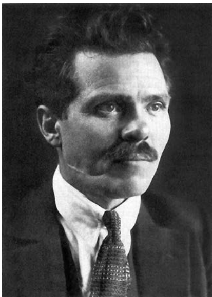
Нестор Махно (фото часів еміграції), один із керівників повстанського руху на півдні України в 1918—1921 роках. Після розгрому більшовиками відступив на територію Румунії. 1925 року перебрався до Парижа, де й помер 1934 року

— Знаю, та цього не досить, потрібне загальне повстання, а для нього — підпільні структури серед населення, війська й навіть радвледи.