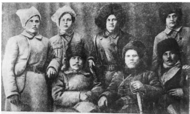
Штаб «Степової дивізії» Холодного Яру. Крайній праворуч сидить отаман Кость Пестушко — «Блакитний», «Степовий»

Але в отамана, який спокійно стояв навпроти, не було ні того, ні того. Тільки ніж у руках. Мить — і він шарконув по горлі бранця.