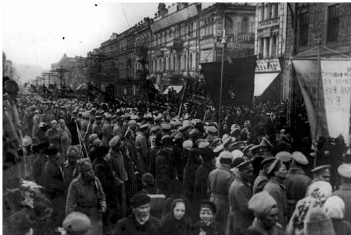
Масова демонстрація на Хрещатику в Києві, березень 1917 року