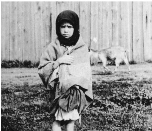
Голодуюча дівчинка з околиць Харкова, весна 1933 року. Фото австрійського інженера Александра Віннербергера, який працював у той час у Харкові. Віннербергер один з небагатьох, хто зумів зафіксувати жахи Голодомору на фотоплівку й вивезти свої знімки за межі СРСР, щоб розповісти світові правду про геноцид українців

Ось уже два місяці, як він намагався врятувати це смішне колись, а тепер жалюгідне чорне створіння. За цей час їх сім'я поменшала на двох — спочатку охоронець колгоспної комори підстрелив татка, який намагався її відкрити. Татко навіть не ховався, навпаки — вмисне голосно ламав ті кляті двері, сподіваючись, що до нього приєднаються й інші. Та не приєдналися, і його тіло ще довго лежало біля дверей комори для постраху тим іншим. А ці двері, як двері до раю для грішників, залишалися зачиненими.