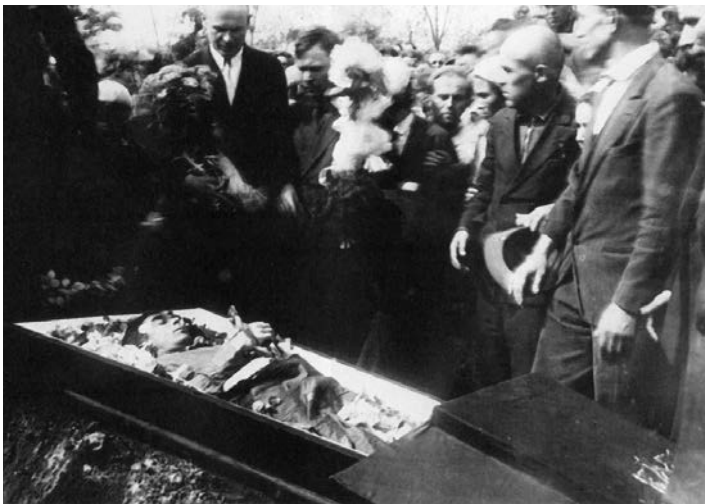
Похорон Миколи Хвильового. Харків, 14 травня 1933 року