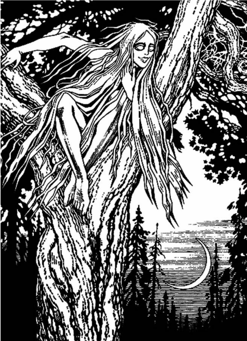
І. Я. Білібін. Русалка в традиційному слов'янському уявленні