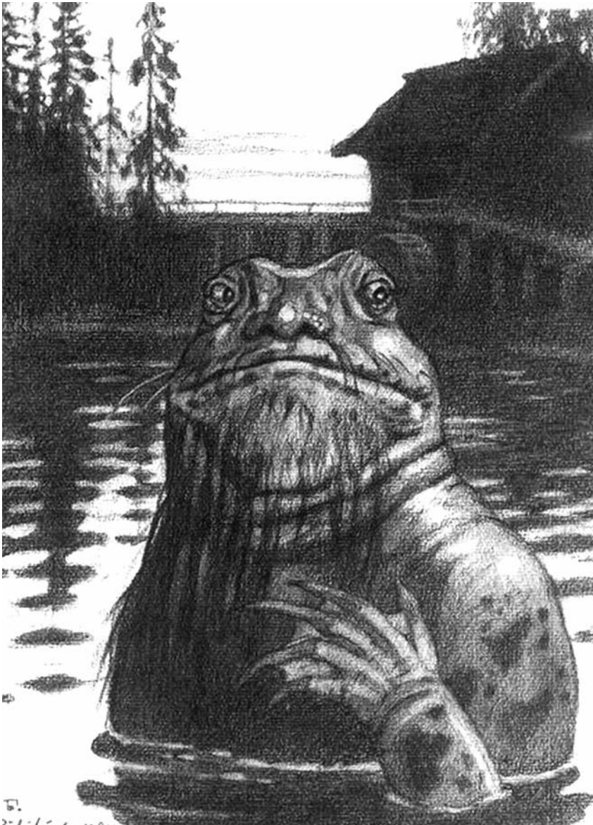
І. Я. Білібін. Водяник