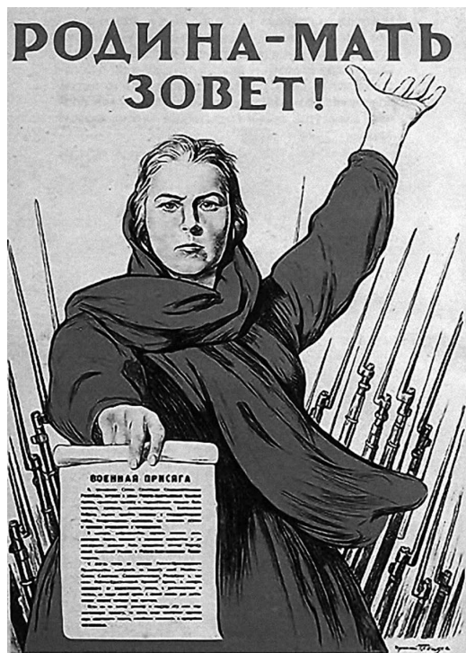
«Батьківщина-мати кличе!» Найвідоміший радянський плакат часів війни, що закликає громадян стати на захист вітчизни, тобто СРСР

«Велика Вітчизняна війна» — це радянська історіографічна та ідеологічна концепція, яку створив СРСР, та яку дотепер нав'язливо використовує Російська Федерація як альтернативу до терміна «Друга світова війна» зі сподіванням зберегти вплив на Україну та пострадянські республіки. Спочатку словосполучення було орди-