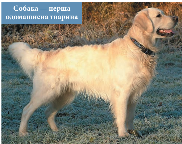
Собака — перша одомашнена тварина

✿ Найперші відомості про одомашнення тварин в Україні належать до епохи мезоліту, VII—VI тис. до н. е. Першою одомашненою твариною був собака. У мідну та бронзову доби одомашнили й інших тварин, зокрема коней, яких згодом об'їздили.