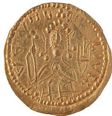
Златник Володимира Святославича

За часів Київської Русі тризуб був родовим знаком Рюриковичів. Його зображення археологи знаходять на монетах, печатках, посуді, цеглі, настінних розписах тієї доби.