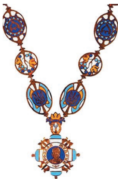
Знак ордена князя Ярослава Мудрого I ступеня