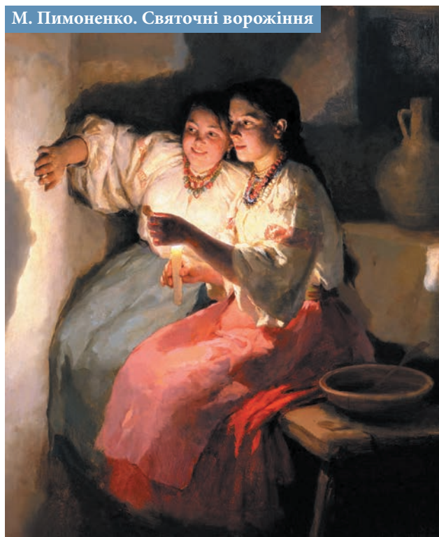
М. Пимоненко. Святочні ворожіння

Вечір напередодні Старого Нового року називають щедрим, або святом Меланки. Знаменний він тим, що цього дня, за давніми традиціями,