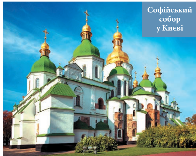
Софійський собор у Києві

✿ В історичній літературі наведено чимало версій щодо походження слова «козак». Один із польських дослідників виводив це найменування від імені легендарного ватажка, що в давнину успішно боровся з татарами. Інший, теж польський науковець, стверджував, ніби ця назва походить від слова «коза». Також висували версії, згідно з якими козаки не українці, а нащадки відомих за часів Київської Русі