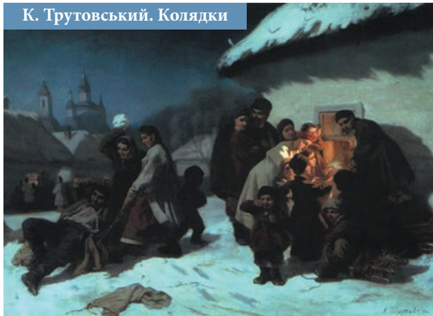
К. Трутовський. Колядки

Засіяла звізда з неба до землі, Зійшли ангели к Діві Марії. Співають Їй пісні, Господній Невісті, Радості приносять.