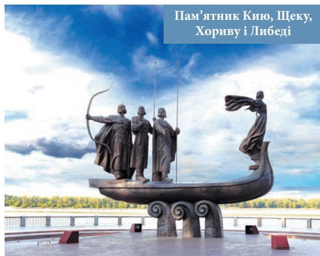
Пам'ятник Кию, Щеку, Хориву і Либеді

✿ Київ став столицею Русі — першої руської держави (кінець IX ст. — 40-ві роки XIII ст.). Місто було збудоване на землях союзу полянських племен, але згодом увійшло до складу земель, які належали східнослов'янським племенам. У XI ст. Київ був найбільшим містом Європи, у п'ятдесят разів більшим за площею, ніж тогочасний Лондон, і в десять разів більшим, ніж Париж. Місто сягнуло найвищого розквіту за князювання Ярослава Мудрого (1019—1054 рр.).