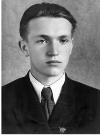
В. Чорновіл. 1955 р.

У 1966 році на судилищі над Богданом і Михайлом Горинями, Мирославою Зваричевською та Михайлом Осадчим В'ячеслав