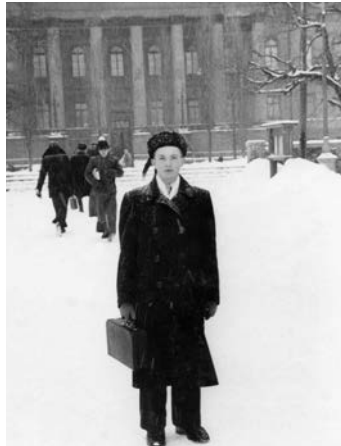
У студентські роки. Київ, друга половина 1950-х років