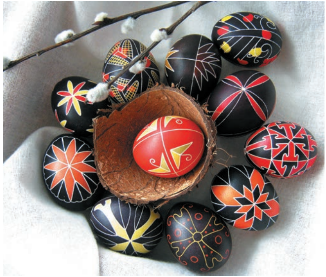
Традиційні писанки Середньої Наддніпрянщини (за колекцією Володимира Ястребова)

Писанка — цей мініатюрний витвір народного мистецтва — є потужним конденсатором краси, якою наш народ збагатив спадщину православної традиції. Цей сакральний предмет, створений власноруч зі щирою молитвою та добрими помислами, неодмінно стане змістовною окрасою вашого життя. Адже це не просто гарно розписане яйце. Кажуть, коли даруєш писанку — ніби вручаєш листівку з побажаннями. Проте писанка — це більше ніж віталь-