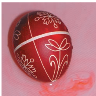
Аніліновий барвник боїться води і сонця