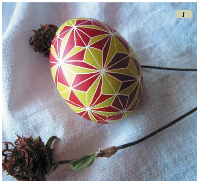
Рис. 1. Автор орнаменту — Олександр Ладік, писанка фарбована аморфою куцвоюю і цезальпінією