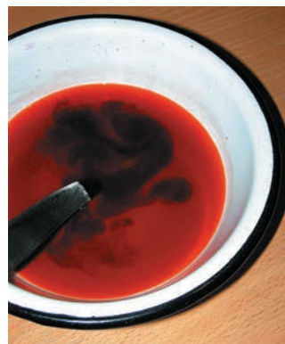
Додавання протравлювача до барвника з цезальпінії