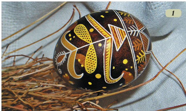
Рис. 1. Писанка, виготовлена за традиційними гуцульськими мотивами, фарбована цвітом бузини, листям горіха (як ґрунт), сандалом і кошеніллю

Барвник дасть помітну барву приблизно за 25 хвилин. Наступного дня теж фарбуватиме.