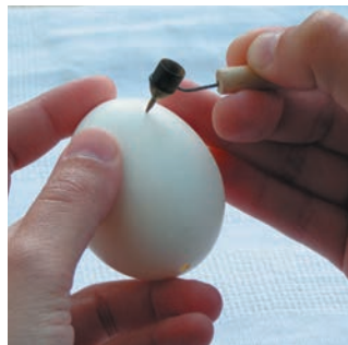
Як тримати писачок

Найпростіша писанка починається з написання основи — базових ліній, на які спирається увесь орнамент. Їх зазвичай пишуть по білому тлу, коли яйце ще чисте. Писанки з жовтими чи червоними лініями основи є вкрай рідкісними. Інколи трапляються зразки з умовним поділом — у такому разі на яйці ліній основи немає, але вони маються на увазі. Писанку з умовним поділом написати важче.