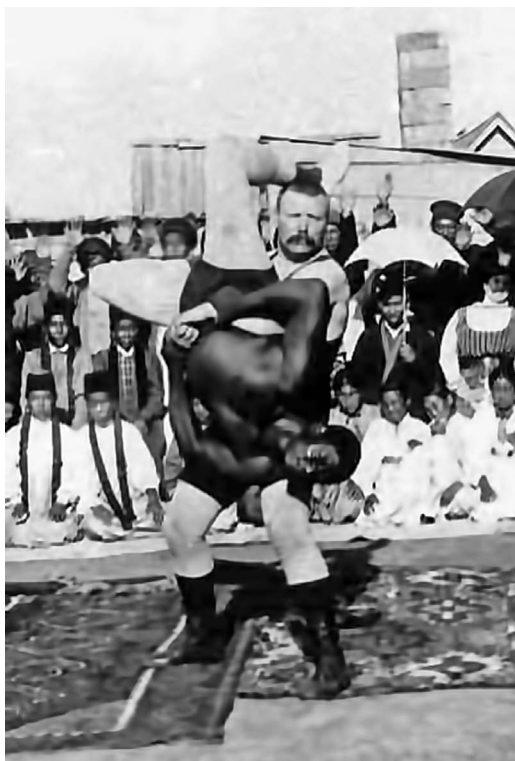
Іван Піддубний проводить прийом проти свого супротивника на одному з міжнародних турнірів

Про борця-силача заговорили у Санкт-Петербурзі — столиці Російської імперії. Піддубним зацікавився тодішній меценат спорту граф Георгій Рібоп'єр, який був представником Петербурзького атлетичного товариства. 1903 року він запрошує Піддубного до столиці і пропонує після серйозного навчання французькій боротьбі взяти участь у паризькому чемпіонаті світу. Український силач погоджується і після лише 3 місяців тренувань їде на чемпіонат до Парижа. Там збиралися на змагання 130 найкращих борців зі всього світу. У театрі «Казино де Париж» Піддубний зумів перемогти в 11 поєдинках.