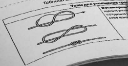
Таблица 3.5. Виды узлов и их применение