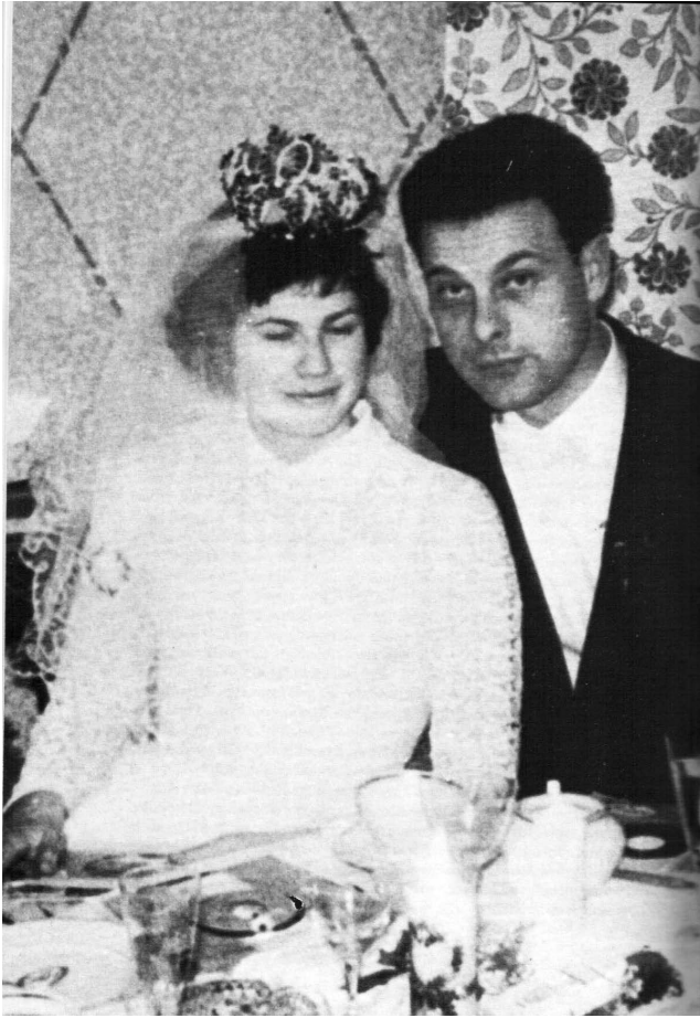
Фото весілля Сташинського та Інге Поль. Східний Берлін, квітень 1960 р. За вбивство Бандери Сташинського було нагороджено орденом Бойового червоного прапора, але головне — він переконав голову КДБ Олександра Шелєпіна дозволити йому одружитися з громадянкою Східної Німеччини, Інге Поль, яка невдовзі переконає Сташинського втекти на Захід. Подружжя перетнуло кордон між Східним і Західним Берліном ввечері 12 серпня 1961 р., усього за кілька годин перед початком будівництва Берлінської стіни (Richard Deacon and Nigel West. Spy! Six Stories of Modern Espionage . London, 1980, с. 125 p.)