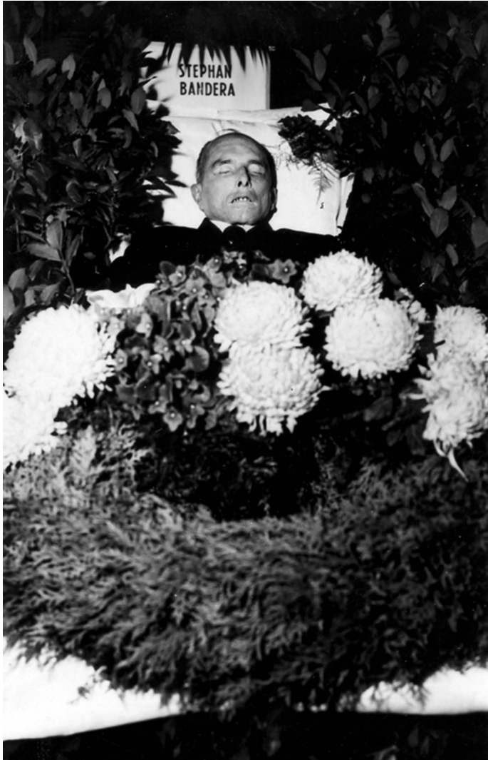
Степан Бандера у труні. Його смерть і похорон 20 жовтня 1959 р., всупереч розрахункам Кремля, не спричинили нових розколів в ОУН, зміцнивши натомість солідарність між різними групами еміграції