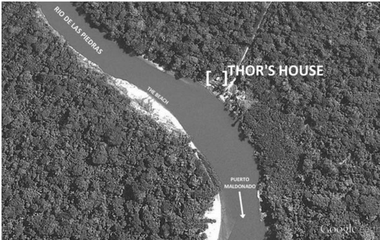
Хатина Тора Сандерса і пляж на протилежному березі Ріо-де-лас-П'єдрас — супутникове зображення з «Google Earth»