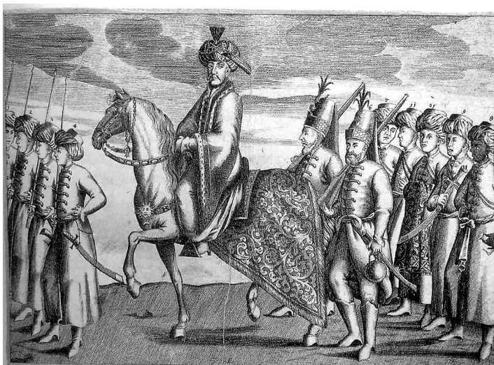
Султан Мегмед IV. Гравюра XVII ст.

протекцію. У відповідь до Чигирини відбуло велике посольство на чолі з Мегмед-агою, котрий привіз Хмельницькому грамоту великого візира Мустафи з повідомленням, що султан, милостиво зваживши на клопотання гетьмана, погоджується виявити Військові Запорозькому свою високу ласку і взяти його «в підданство і покровительство». Крім грамоти Мегмед-ага привіз гетьманові також атрибути влади залежного від Порти васала — булаву, бунчук, кафтан і знамено. При цьому Стамбул запропонував Хмельницькому протекторат на умовах, що були значно кращі, ніж ті, які визначали статус Кримського ханату. Так, гетьманський уряд мав би передати Порті під управління і розміщення свого гарнізону місто Кам'янець-Подільський, яке мало б стати не лише місцем розташування османської адміністрації, а й уособлювати зверхність султана над Україною. Як плату за покровительство й опіку, Гетьманат повинен був щорічно сплачувати султану данину в розмірі