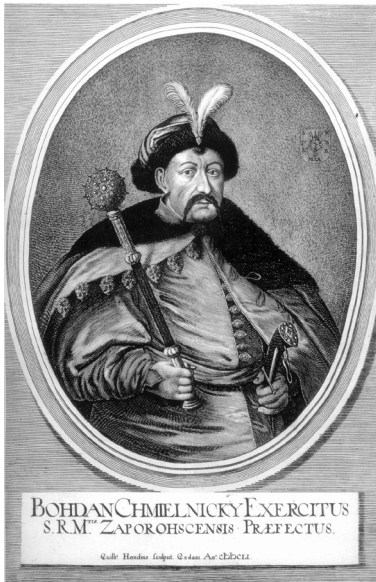
Богдан Хмельницький, гетьман Його Королівської Милості Війська Запорозького. Гравюра В. Гондіуса

поступаються місцем хоч якомусь компромісу. Компромісу, який, утім, лише на деякий час вгамує несамоовиту лють супротивників, але нічого не змінить засадниче. Отже, після нетривалого умовного миру «Дикі Поля» (скористаємось цим штампом польської історіографії) неминуче запалають смертоносним полум'ям нової війни.