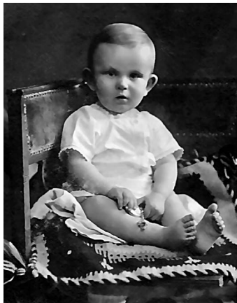
Так виглядав майбутній командир у дитинстві. Львів, 1907—1909 р.

Роману було тільки 19 років — він народився 1907 року