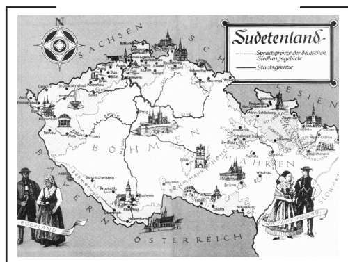
Німецька пропагандистська карта чеських земель ЧСР. Сірим кольором позначено регіони компактного проживання етнічних німців, 1930-ті рр.

світовій зробили ставку на Чехословацьку республіку (не в останню чергу — через загрозу розширення Угорської радянської республіки). Місцеві німці, звісно, протестували, ходили на демонстрації, саботували розпорядження чехословацької адміністрації (чехословацька армія зайняла регіон ще у листопаді 1918 року). 4 березня 1919 р., коли в Австрії відбувалися парламентські вибори, в 11 місцевостях відбулися сутички німецького населення з чехословацькою армією, жертвами яких стали 58 осіб. Незабаром усе було закріплено офіційно: у Сен-Жерменському договорі від 10 вересня 1919 р. передбачили уведення цих земель до ЧСР.