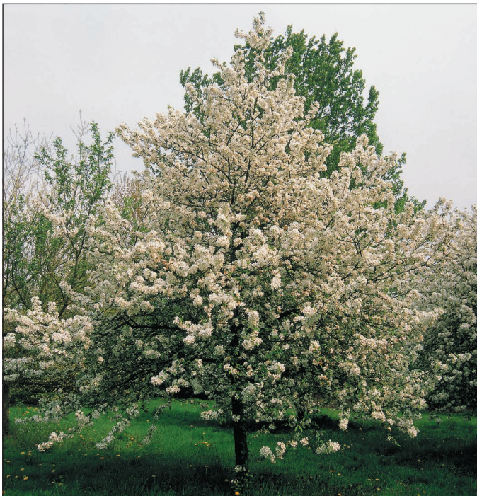
ВВЕРХУ Великолепная декоративная яблоня сорта «Эверест» ( Malus «Evereste») в полном цвету. От обрезки, придавшей кроне определенную форму и повывисившей урожайность, дерево только выиграло

Обрезка относится к таким видам работ, которые большинство садоводов либо не любят, либо боятся, либо и не любят, и боятся. Боязнь отчасти связана с тем, что большинство работ по уходу за садом кажутся продиктованными здравым смыслом, тогда как обрезка куста или дерева представляется каким-то решительным деянием и, если что-то получится не так, удручающие последствия будут видны всякому. До некоторой степени эта задача сродни подстриганию волос своей подруге — операции, которую вы бы, наверное, предпочли поручить профессиональному парикмахеру. Другая задача, которая тоже считается мудреной, а именно размножение растений, вовсе не является проблемой, поскольку если не взойшли семена или не принялся черенок, кто об этом узнает? Да, обрезка — безусловно, дело хитрое. А так ли это на самом деле?