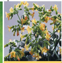
С оранжевыми цветами