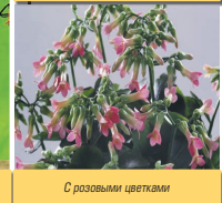
С розовыми цветами

Описание сортов. Объем данной книги не позволяет описать все разнообразие сортов, поэтому мы вынуждены ограничиться отдельными видами. Учтите, что не в каждом цветочном магазине можно найти любой желаемый сорт, так что узнайте вначале о наличии в магазине интересующего вас сорта.