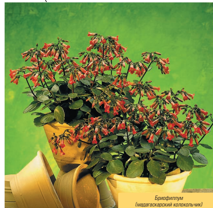
Бриофиллум (мадагаскарский колокольчик)

Совет: для лучшего разветвления после цветения провести обрезку.