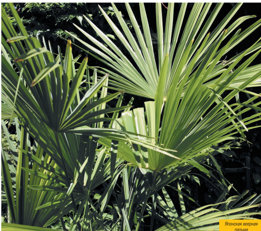
Японская веерная пальма