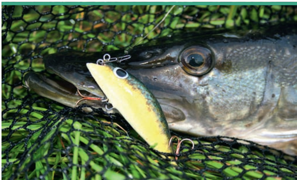
Эта щука клюнула на самодельный безлопастной воблер, имитирующий гольца.

Если щук слишком часто беспокоить днем, то они могут перейти на ночной режим кормления. Используемые при ночной рыбалке воблеры не должны быть слишком ярких расцветок, ведь обычная добыча хищницы не выглядит в ночное время разноцветной. Колебаний, исходящих от безлопастного воблера или воблера с маленькой лопастью, вполне достаточно, чтобы привлечь внимание щук. Вечером и ночью рыбакам следует предпочитать высокоспинные модели воблеров широкоспинным, так как при правильной проводке первые лучше имитируют движение испуганной рыбки; при этом их бока начинают слегка поблескивать, как только рыбак начинает вращать рукоятку катушки.