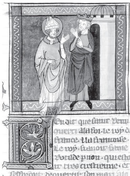
Король Хлодвиг и св. Ремигий. Французская миниатюра. XIV в.