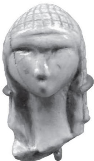
Женская головка из зуба лошади. Образец искусства эпохи палеолита из пещеры Мас-д'Азиль, департамент Арьеж. IX–VII вв. до н. э.

2. Никогда не существовало народа французской национальности. Та территория, которая является нынешней Францией, располагалась на краю Европейского континента. Здесь завершались вторжения, и здесь останавливались и поселялись завоеватели. В конце первого тысячелетия до нашей эры в Альпах проживали лигуры, в Пиренеях — иберы, от которых, возможно, и происходят современные баски. По Средиземному морю приплывали финикийские моряки; Монако — это финикийское слово, означающее отдых, остановка . Семитские купцы обменивали на рабов жемчуг, гончарные изделия и яркие ткани. Позднее греческие мореходы основали на побережье колонии и привезли с собой цивилизацию Востока, религиозные веяния, таинства, деньги, культуру оливковых деревьев и более совершенный язык. Из своей главной колонии Массилия (Марсель), основанной моряками из ионийской Фокеи около 600 г. до Рождества Христова, греки сделали торговый порт, через который транзитом шло олово, вывозимое из Британии. Марсель разрастался, и на побережье возникали новые греческие города: Никея