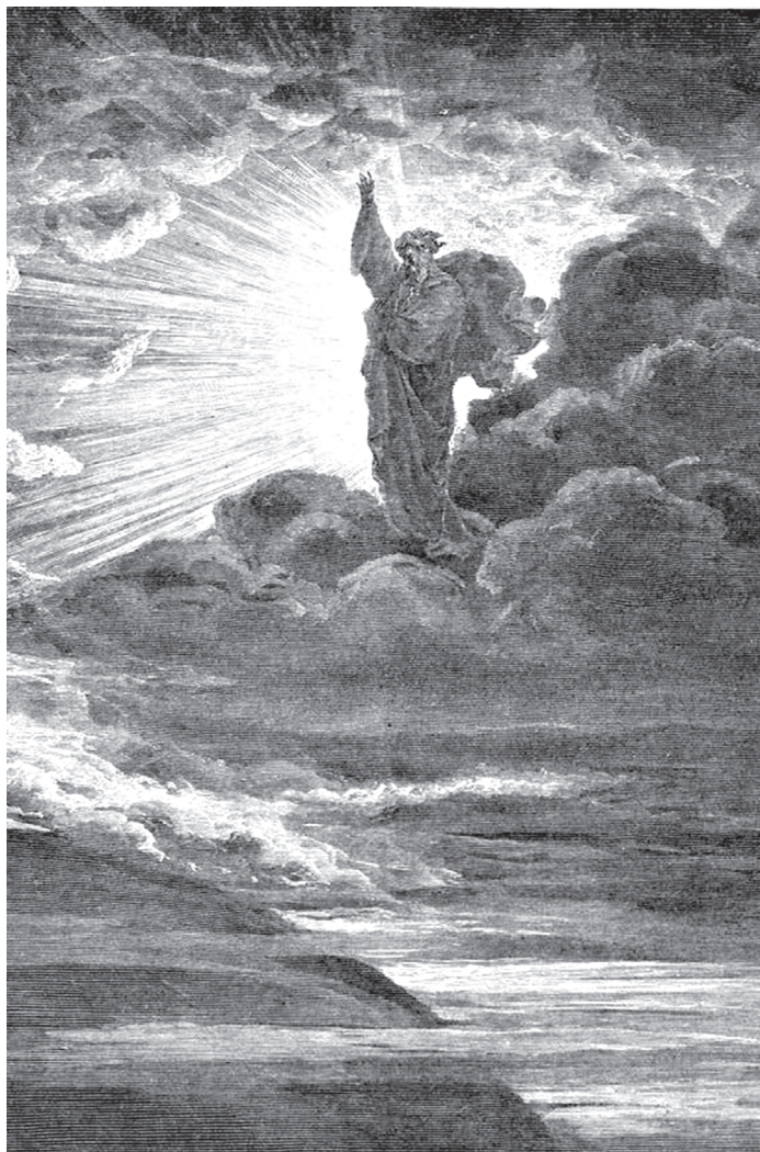
Г. Доре. «И стал свет»

И сказал Бог: да будет свет. И стал свет. И увидел Бог свет, что он хорош; и отделил Бог свет от тьмы.