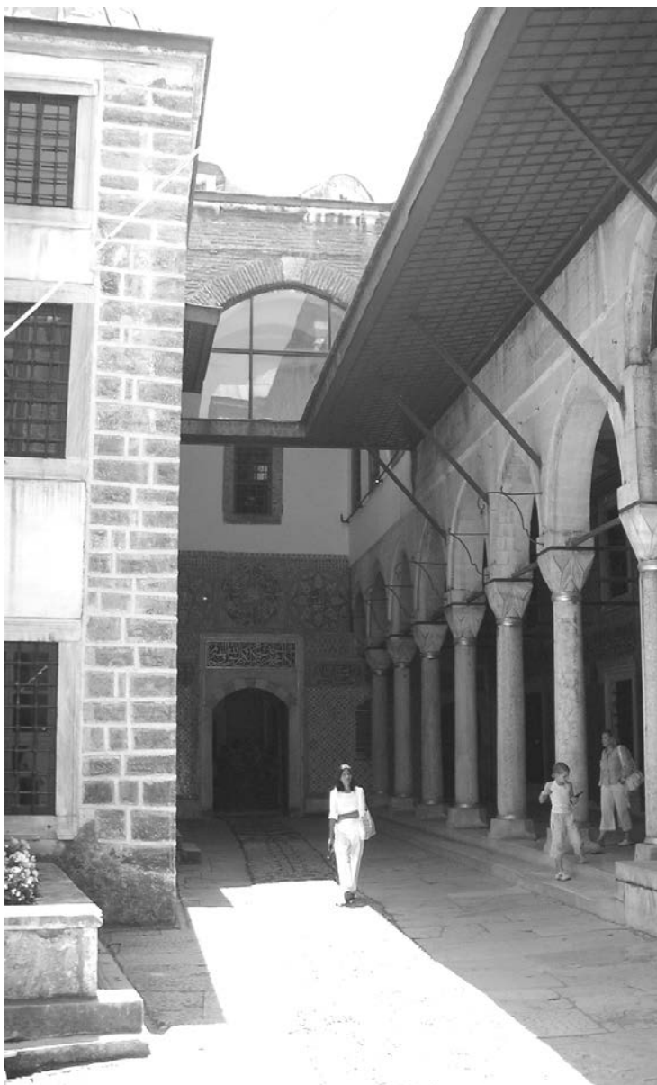
Ташлик (дворик) євнухів Нового палацу (Топкапи)