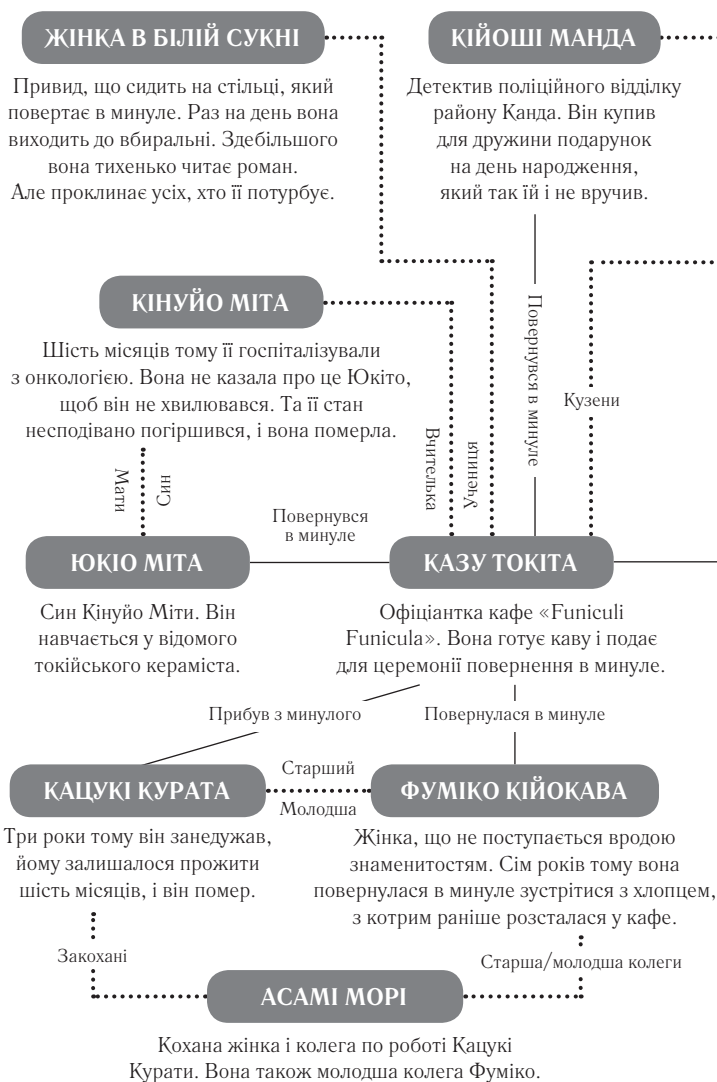
Схема зв'язків між героями «Доки не розкриється брехня»