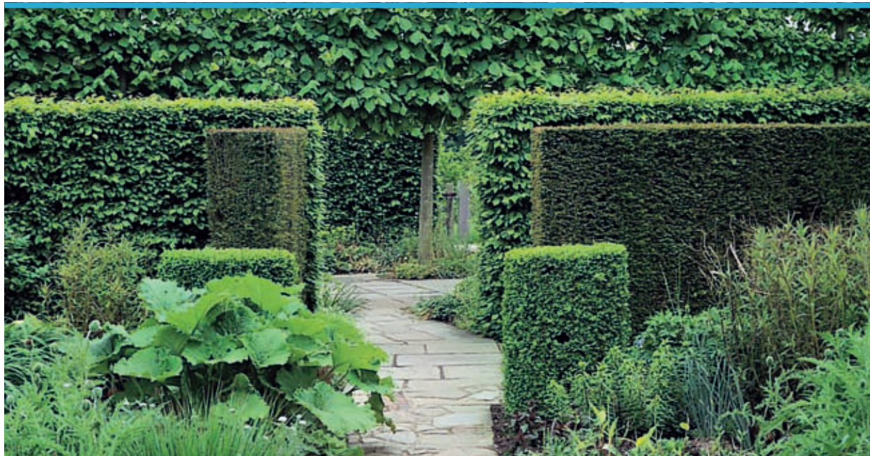
Расположение живых изгородей и подстриженные кроны деревьев создают объемную пространственную перспективу

Изгороди разной высоты позволяют зрительно увеличить сад. Кроме того, они создают таинственность, вызывая желание посмотреть, что за ними находится. Таким образом создается ощущение объема.