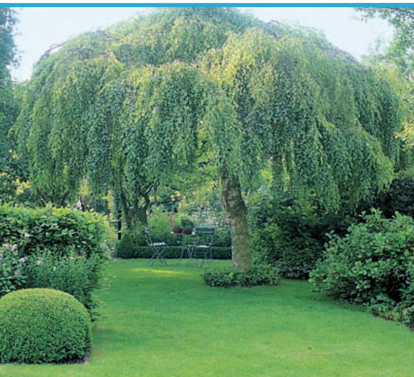
Деревья, кустарники, живая изгородь и вьющиеся растения различных размеров и форм роста являются основными элементами сада

Деревья, кустарники и вьющиеся растения погружают сад в зеленый цвет. Они создают объем и образуют внешние границы сада, а также делят его на разные части. Красивые единичные деревья расставляют акценты в саду. На террасе приятно