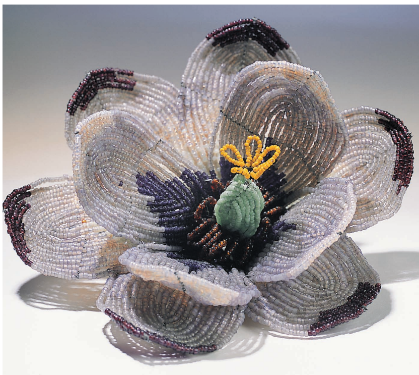
Пополнить знания о старинной французской технике плетения цветов из бисера мне помогли антикварные магазины

Следуя ее примеру, я начала изучать французскую технику плетения цветов из бисера. Теперь я испытываю радостное чувство, видя счастливые улыбки своих учеников, когда они в конце дня заканчивают плести прекрасные букеты. Результатом их творческих успехов стало написание этой книги. «Искусство французского плетения цветов из бисера» — мечта, которая стала реальностью. Это шанс поделиться своими достижениями в создании любимых моделей цветов из бисера, сплетенных во французской технике, которую я долго изучала. Надеюсь, вы получите удовольствие от чтения этой книги, так же как я получаю удовольствие от работы с бисером, и думаю, что вы также разделите мою любовь к этому прекрасному виду искусства.