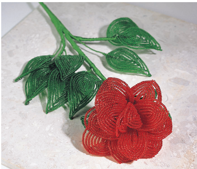
Розы были моим первым опытом создания цветов из бисера