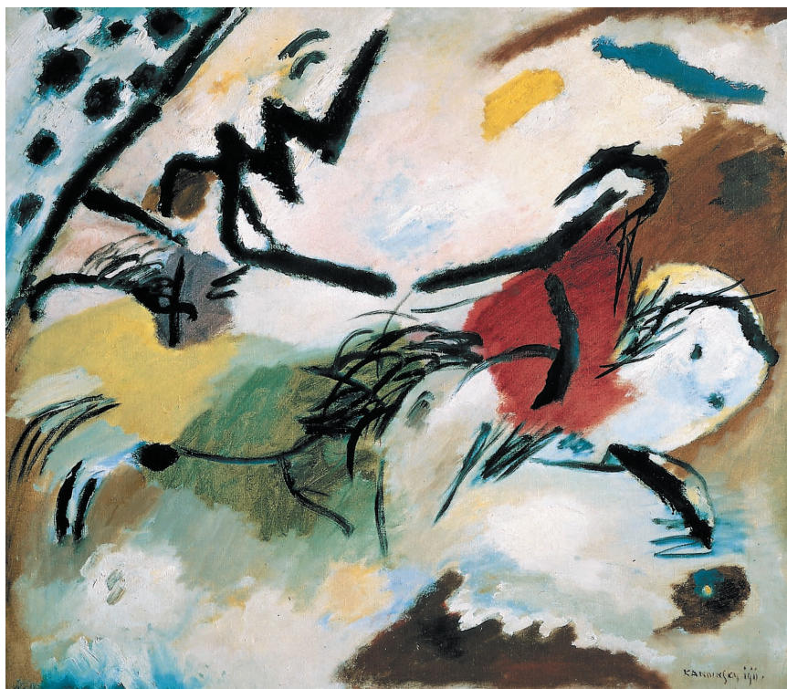
Абстрактне мистецтво. Картину «Імпровізація № 20» створив Василій Кандинський у 1911 році.

Ти можеш зробити власний витвір абстрактного мистецтва. Нанеси чайну ложку акварельних фарб на аркуш паперу й подуй на калюжку через соломинку так, щоб фарба розтеклася в різні боки нерівномірними смугами та ляпками.