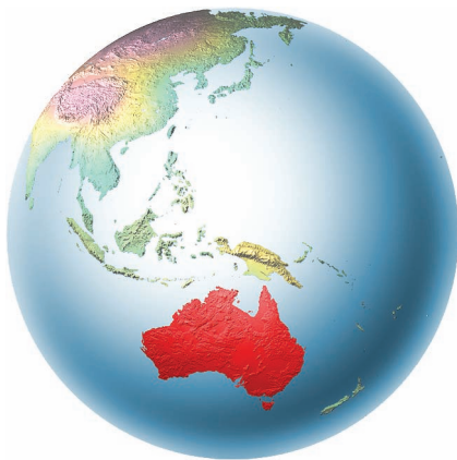
Обриси й розташування Австралії