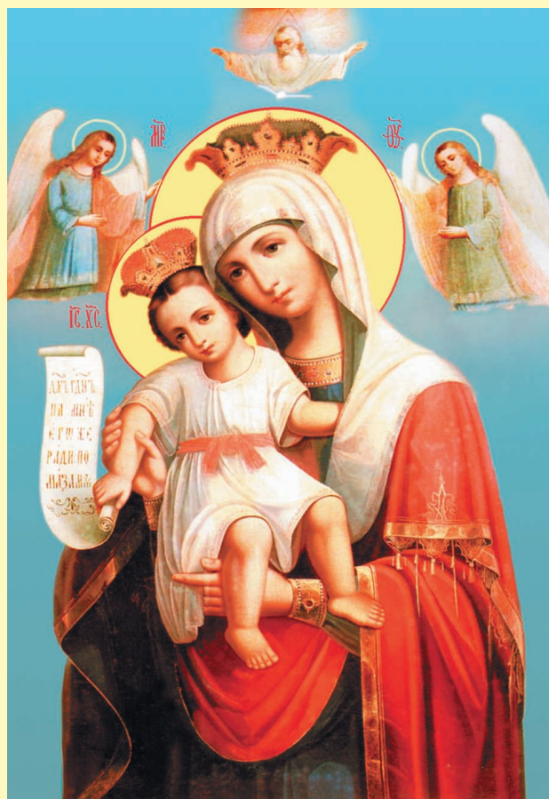
Образ Пресвятой Богородицы «Достоинно есть»

Святые тесно связаны между собой и со Христом. Поклоняясь святым, мы почитаем Христа, Который живет в них: «Христос есть начало, середина и конец. Он есть во всех — и в первых, и в средних, и в последних... — говорит преподобный Симеон Новый Богослов (XI в.). — Те, кто из рода в род через исполнение заповедей становятся святыми, приходя на смену прежним святым, соединяются с ними, озаряясь, подобно им, и принимая благодать Божию по причастию, и все они становятся как бы некой золотой цепью, будучи каждый отдельным звеном, соединяющимся с предыдущим через веру, дела и любовь». Золотая цепь христианской святости тянется от апостольского века до наших дней: и сейчас есть немало святых — тайных и явных, — которые когда-нибудь будут прославлены Церковью.