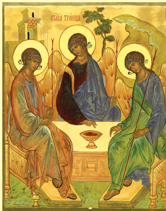
Образ Пресвятой Троицы

выражения типа: Павел более человек, нежели Иоанн, так как оба они являются в равной степени представителями одной природы (класса) — человеческой. Так и в Пресвятой Троице: Лиц (Ипостасей) — три, а Божественная природа — одна, поэтому одно действие, воля, свойства у трех Божеских Лиц. Однако существуют и индивидуальные (ипостасные) особенности каждого Лица Пресвятой Троицы. Свт. Григорий Богослов их сформулировал следующим образом: Бог Отец не рождается и не исходит от другого Лица, Бог Сын (Логос, или Слово) предвечно (т. е. всегда) рождается от Отца, а Бог Дух Святой предвечно исходит от Отца.