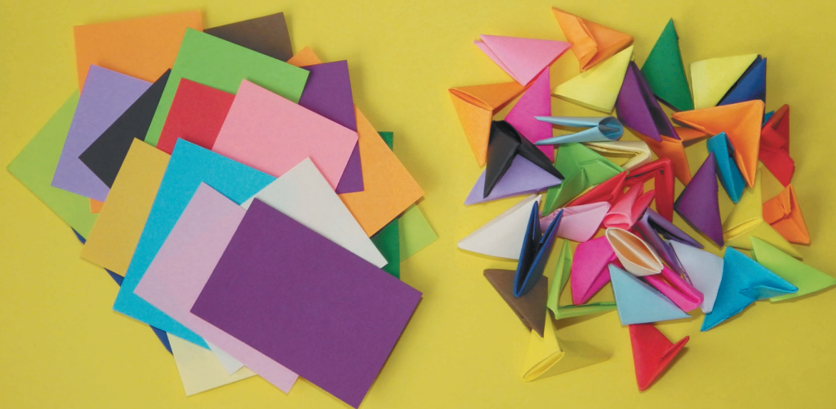
Треугольные модули, сложенные из цветных прямоугольников

Модуль — это один из элементов, из которых собирается объемная фигура, выполненная в технике модульного оригами. Модули бывают разные, но в этой книге используются только треугольные модули, сложенные из прямоугольников.