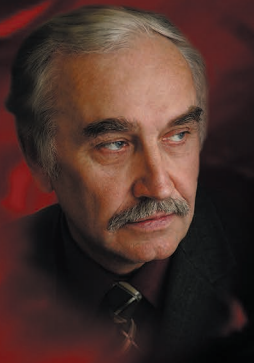
Фото люб'язно надано автором