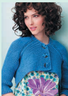
Соблазнительные изгибы. Кардиган на пуговицах (с. 82)