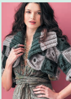
Калейдоскоп. Болеро в стиле печворк (с. 70)