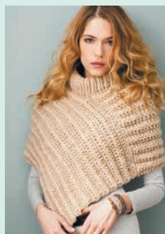
Острые уголки. Пончо узором «Резинка» (с. 50)

Для вязания изделий, вошедших в эту книгу, подойдет любая пряжа. Из камвольной пряжи и стандартной пряжи средней толщины получается полотно средней плотности, которое согреет в любое время года. Толстая пряжа подойдет для надеваемых в холодную погоду изделий. Я люблю пряжу из овечьей шерсти и альпаки, но не смогла устоять перед уютным мохером, прихотливым букле, гламурным металликком, тонким хлопком, пушистой синелью — этот список можно продолжать до бесконечности. Иногда именно пряжа служила исходным толчком для создания той или иной модели, как, например, в случае с накидкой с широким воротником (с. 78), в которой простой силуэт подчеркивает красоту пряжи ручной окраски. В других моделях я отталкивалась именно от формы, как при создании пуловера с широким воротником (с. 14), мне хотелось, чтобы он получился объемным, ярким, разноцветным, поэтому я соединила три нити камвольной пряжи разных цветов. Не бойтесь экспериментировать — и получите настоящее удовольствие от работы.