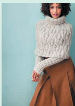
Сливочное мороженое. Пончо со съёмными рукавами (с. 122)