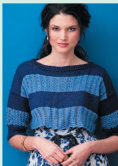
Голубое вам к лицу. Полосатый ажурный пуловер (с. 126)