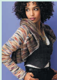
Палитра художника. Рифленое болеро (с. 38)