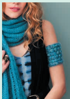
В греческом стиле. Палантин с манжетой (с. 22)