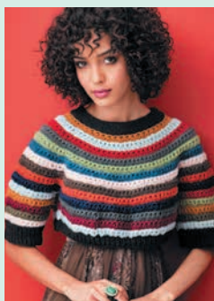
Веселая карусель. Пуловер в полоску (с. 26)