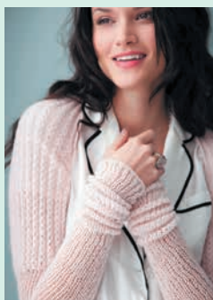
Нежный румянец. Кашемировый шраг (с. 58)