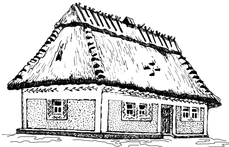
Мал. 1. Традиційне житло. Поділля

На Поліссі житла зводили з дерева. Найдавніші з них були однокамерними (складалися тільки з житлового приміщення). У XVI ст. відбулися інтенсивні соціально-економічні процеси, які стимулювали розвиток хліборобства, розширення торгівлі. Усе це позитивно позначилося й на характері будівництва. Широкого застосування набуває різане дерево; рублені дахи замінюються кроквяними; поширюється покриття соломкою, побілка житлових