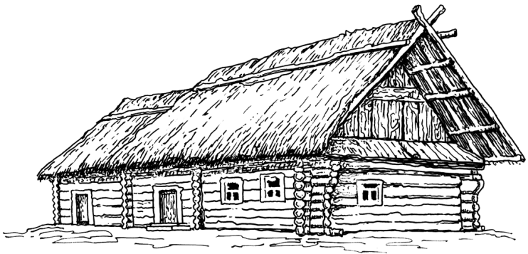
Мал. 2. Традиційне житло. Полісся

У Середній Наддніпрянщині житло було каркасне та зрубне. Обмежена кількість дерева спричинювала застосування соломи, очерету, лози, які гармонійно поєднувалися. При цьому майстерно використовувалися їх декоративні властивості. Багатоваріантності осель не існувало. Панівним типом тут була хата