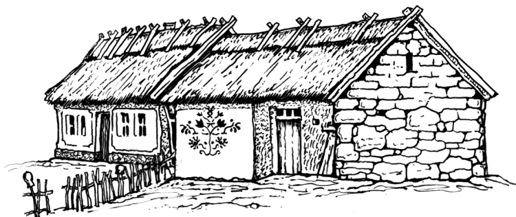
Мал. 3. Традиційне житло. Південь України

з житловим приміщенням, сіними та коморою. На Черкащині, у деяких районах Київщини — з двома житловими приміщеннями й сіними (мал. 4).